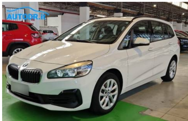
FOTO REALI - VETTURA IN ARRIVO NEI PROSSIMI GIORNI

Per scoprire di più o per organizzare una visita, vi invitiamo a seguire le indicazioni stradali su bit.ly/autodrmapp e venire a visitarci presso AutoDR.it .