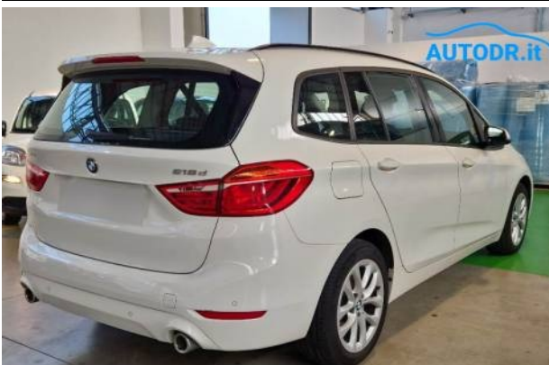
FOTO REALI - VETTURA IN ARRIVO NEI PROSSIMI GIORNI