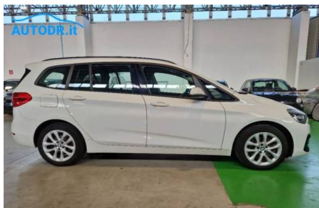
FOTO REALI - VETTURA IN ARRIVO NEI PROSSIMI GIORNI